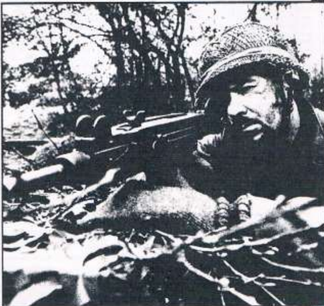
Paar gericht op het bevelen van de vijand.

Duidelijk is echter dat de vijand succes heeft gehad. Na afloop werden ze gecompliceerd door kolonel Geerts, die vertelde ook bij te zijn geweest met het beherste optreden. „In deze omstandigheden, met vermoede en koude mensen, is er niet zoveel nodig om echte knokpartijen te krijgen. Dat is geen enkele keer gebeurd“. En terwijl de oorlog woedde, was een gedeelte van de berhales op de schietkampen van Artillerie (Oldenbroek) en Infanterie (Harskamp) te vinden. Hier speel-