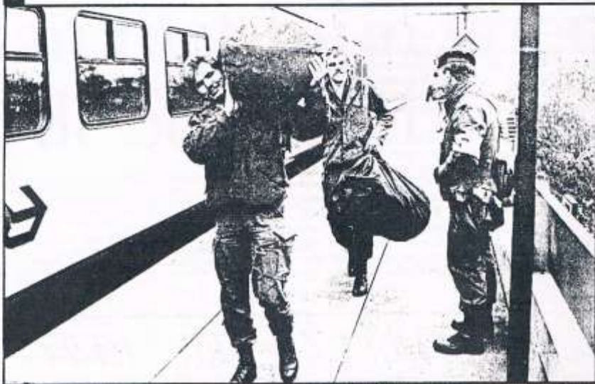
Aankomst per trein

Kou, een tegenvallende opkomst, tijdnood, een zeer gemotiveerde en deskundige oefenvijand, slecht zicht. Maar ook: veel 'ouwe stompen' die wel kwamen, omdat ze bijvoorbeeld de landsverdediging een warm hart toedragen, schietoefeningen die wel doorgingen, vijandpatrouilles die wel gepakt werden, warme maaltijden die wel op tijd waren en het ontmoeten van oude makkers. De jaarlijkse mobilisatie-oefening Donderslag werd vorige week voor de achttiende keer gehouden. De opkomst bleef zo'n tien procent onder de verwachting en ook tactisch ging niet alles van een leien dakje. „We hebben veel geleerd” was het commentaar van kolonel G. A. Geerts, de leider van de tactische oefening, nadat hij 'einde oefening' had gegeven.