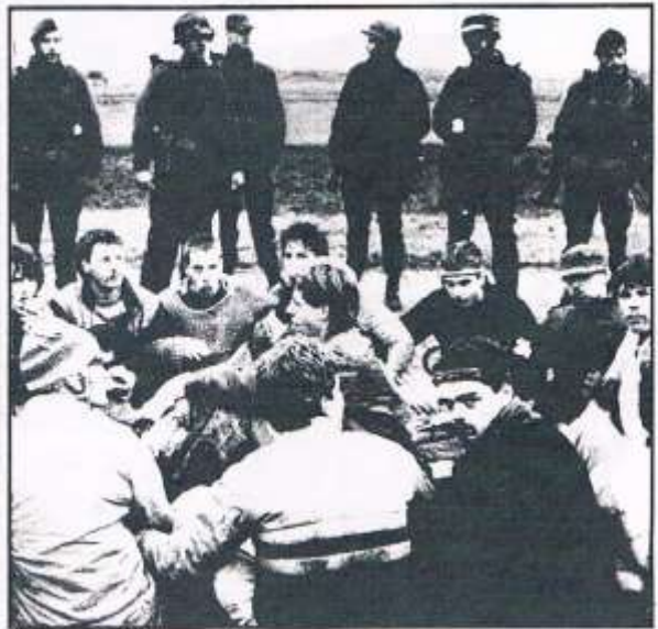
Actievoerders van het NUB

Een ploegje van een man/biften in burger loopt midden in de nacht zelfs anderhalf uur over de starthoen, luid zingend en hertie makend. Zij kunnen ongehinderd de basis weer verlaten. Sergeant B. Aris van 422 IBC vertelt met zichtbaar genoegen dat ze zelfs een nog rouwer staaltje hebben uitgehaald: „Wij hebben bij een heelbel belangrijk punten bordjes neergezet om aan te geven