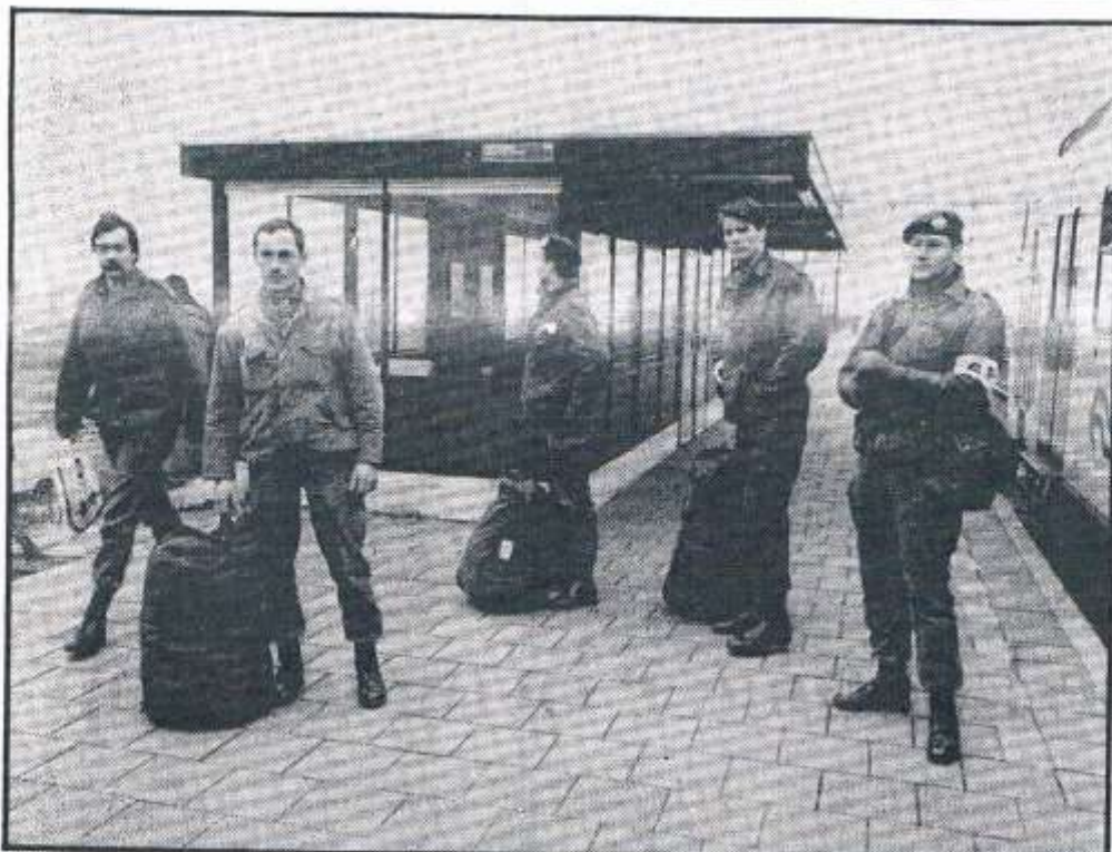
• Op het station van Nieuw-Vennep arriveerden vanochtend al de eerste deelnemers aan de mobilisatie-oefening Donderslag 18.