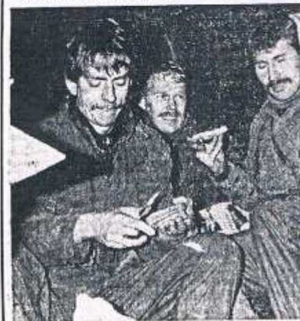
Wachten tot dat je weer naar huis mag. Daar kwam de mobilisatie oefening voor velen op neer.