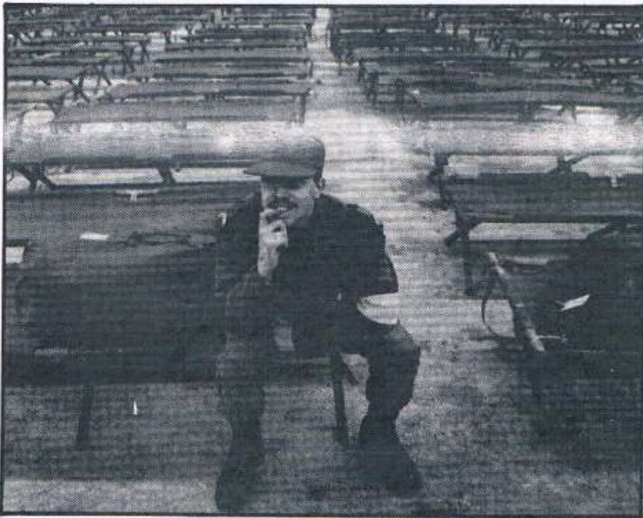
Enzaam zit de soldaat op een stretcher in de industriehal in Nieuw-Vennep te wachten op zijn maatjes. Gisteren is de jaarlijks terugkerende mobilisatie-oefening voor de landmacht 'Donderslag' van start gegaan. Zo'n duizend man van het 327ste infanteriebataljon werden daarvoor per aangetekende brief en via de radio opgeroepen.