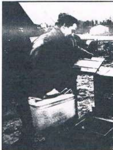
Op het Maaldrift bij Wassenaar

Ondertussen is op een ander mobilisatiecomplex, Maaldrift, in Wassenaar, de keukengroep zeer actief. Er zijn sluisen uitgegraven waarin benzinevergoeters staan te loeten. Op roosters worden in grote