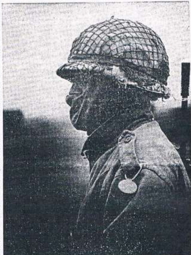
Klompend op wacht tijdens de oefening Donderslag.

Op dinsdag zijn de opgeroepen eenheden zelijk door-